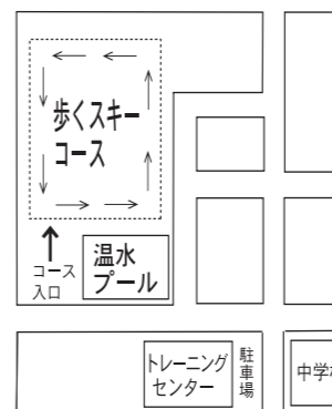
温水プール歩くスキーコース