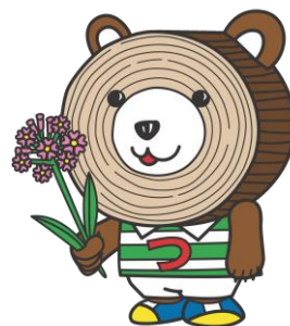
津別町イメージ キャラクター 『まる太くん』

津別町役場 産業振興課 再生可能エネルギー推進グループ 住所 網走郡津別町幸町41番地 TEL 0152-76-2151 FAX 0152-76-2976