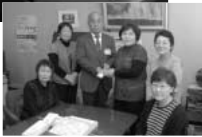
おりづる会の みなさん