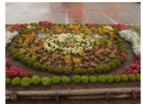
▲優秀賞（左から）豊永第三自治会、幸町自治会、ケアハウスつべつの花壇