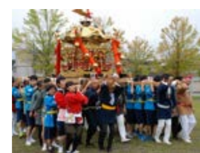
町内を練り歩くみこし