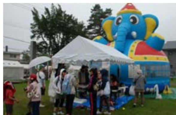
子どもたちに人気のファファ