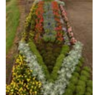
▲優良賞（左から）東達美育苗団体、友楽園すこやかクラブ、津別町商工会女性部、共和老人クラブの花壇