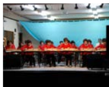
大正琴エスポワールの演奏