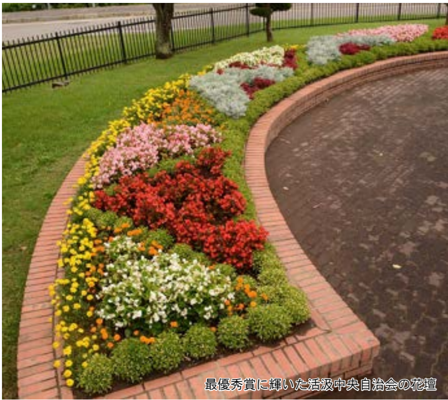
最優秀賞に輝いた活汲中央自治会の花壇