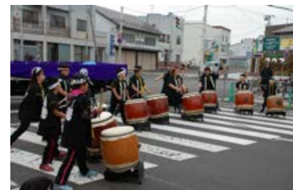
山鳴太鼓保存会の演奏