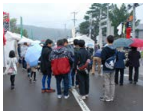
会場の津別神社前町道