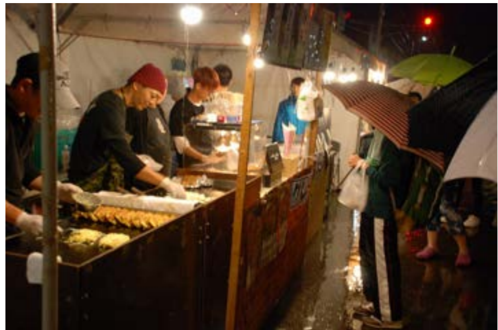
あいにくの雨の中、出店には多くのお客さんが

町民手づくりのお祭り「第25回つべつふるさとまつり」が、今年も9月9日・10日の両日、五差路から津別神社前の町道で開催されました。会場には職場や各団体による様々な食べ物の出店、スマートフォンボール、射的、金魚すくいなどのなつかしい縁日が軒を並べ、町内外から訪れた多くの見物客が秋まつりの風情を楽しみました。 また、同日開催の津別神社例大祭では、みこしや伝統の駒踊りがにぎやかに町内を練り歩きました。