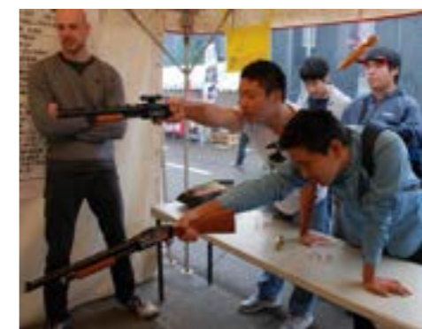
人気の射的コーナー