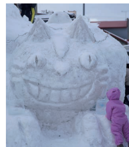
▲実行委員会と消防職員による力作の猫バス