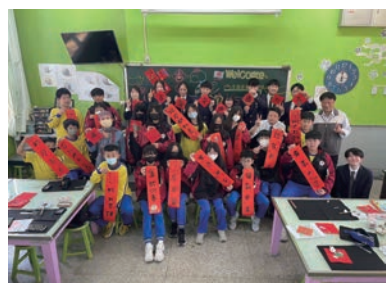
▲二水国民中学校での授業