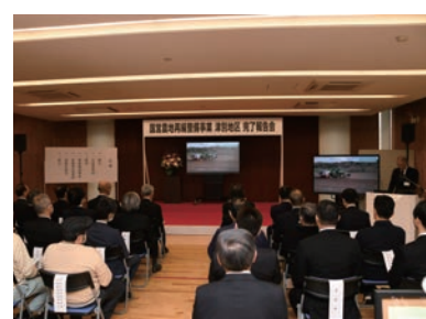
▲映像による事業経過報告