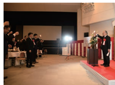
▲オーガニック牛乳で乾杯