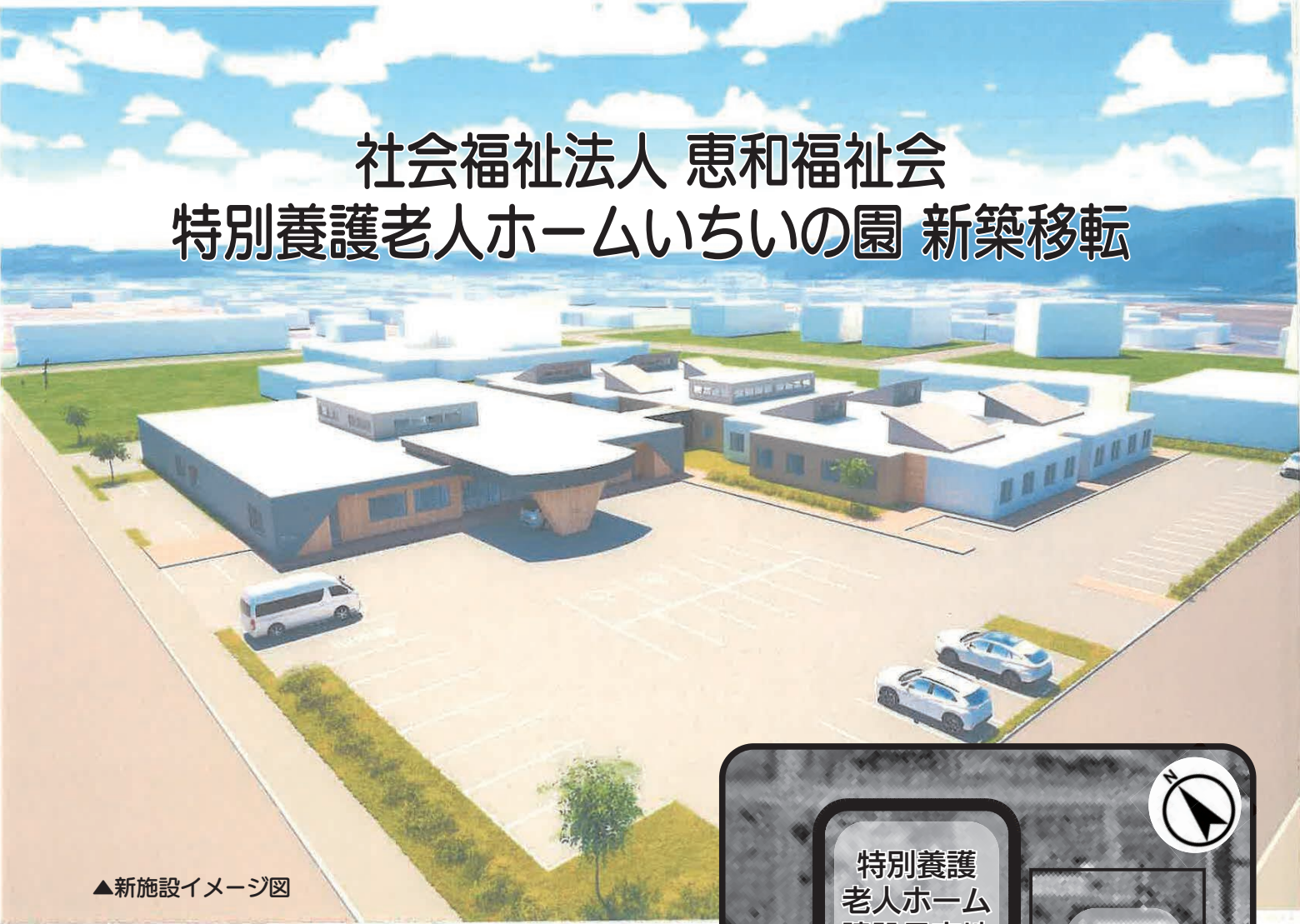
▲新施設イメージ図

施設の概要等新築移転に関する内容 介護度、利用者負担区分及び町の支援内容 特別養護老人ホームいちいの園 津別町保健福祉課介護保険係 ☎ 76 - 3205 ☎ 77 - 8382