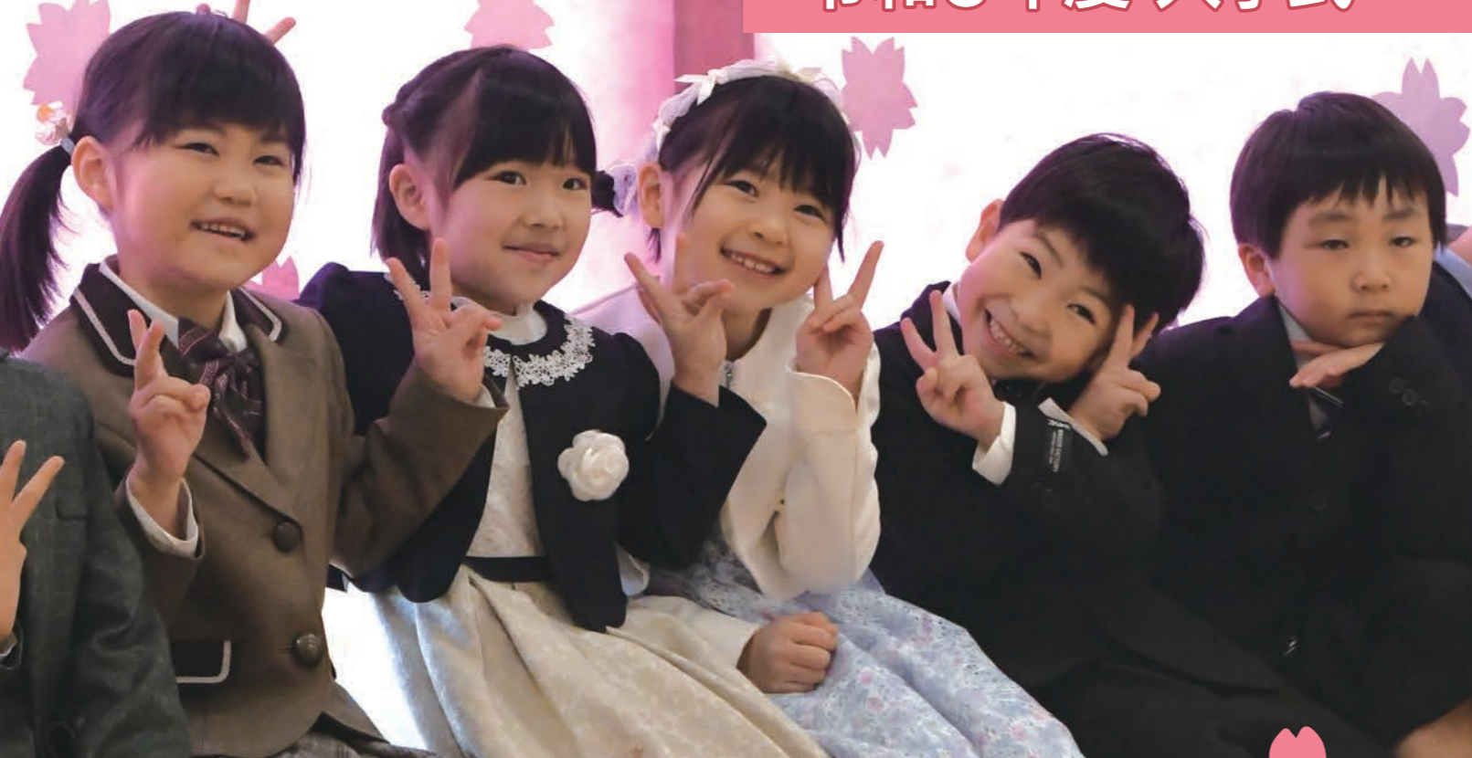
▲津別小学校入学式