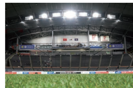
大和ハウス プレミストドーム