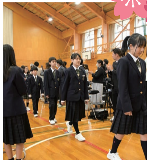
▲津別中学校 入場の様子

4月8日には津別高等学校で入学式が行われ、23人が入学。新入生たちはそれぞれの目標に向けて決意を新たにしていました。同じく4月8日には津別小学校でも入学式が行われ、19人が入学。上級生や先生方の温かな歓迎を受けながら、新しい学校生活を元気にスタートさせました。それぞれの会場では、子どもたちの門出を祝う温かな雰囲気にもまれ、地域全体で新たなスタートを見守る一日となりました。