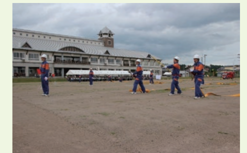
令和7年度 美幌・津別広域事務組合 津別消防団 消防演習ポンプ車操法の様子

なお演習の際には、団員召集・一斉放水時にサイレンを吹鳴します。 ご迷惑をお掛けしますが、皆様のご理解、ご協力をお願いします。