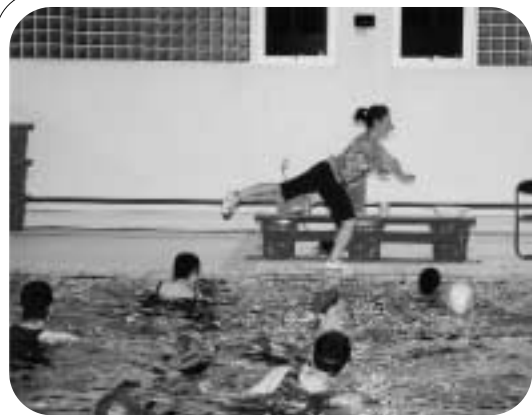
気軽にみんなでシェイプアップ 水中エアロビ教室が開催

役場保健福祉課国保係 ☎ 76-2151 内線228・229 北海道後期高齢者医療広域連合 ☎ 011-290-5601