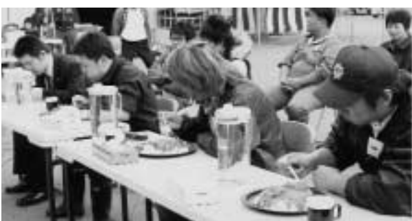
大きな歓声があがった特製大盛りカレーライス早食い競争!

この日も朝早くから格安の大根、白菜、キャベツなどを買い求める人でテント前は溢れていました。また、人気の玉ねぎとじやがいの詰め放題コーナーには長蛇の列ができました。海産物の屋台も出店され新鮮な秋鮭などを買い求めていました。初登場の特製大盛りカレーライス(総重量1kg)早食い競争には12人が出場。苦しみながら食べる出場者に声援が送られていました。