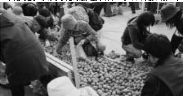
格安の野菜を求めて多くの人で賑わいました