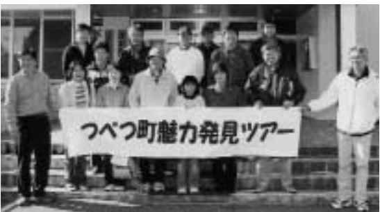
13人が参加した「第1回つべつ町魅力発見ツアー」