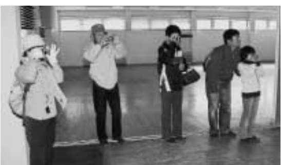
旧Kニツツベツ工場を撮影する参加者のみなさん

ツアー参加者からは「相生小学校を林間学校に活用しては?」「旧営林署を取り壊し整地にして活用しては?」「Kニツツを冬期間の運動場や趣味の展示場にしては?」などいろいろな意見が聞かれました。11月17日に今回撮影した写真を使用してアイデア発表会が開催される予定です。