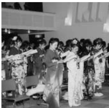
町民憲章を朗読する51人の新成人