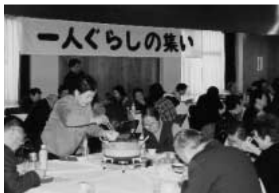
おいしい料理に会話も弾む 一人ぐらしの集いに84人参加

1月17日、町民会館で一人ぐらしの集い（社会福祉協議会主催）が開催され、町内在住の65歳以上の84人がおいしい料理やゲームをして交流を深めました。この日は寄せ鍋、赤飯、お汁粉などボランティアの方々による豪華なメニュー。みんなで食べる料理に会話も弾み笑顔が溢れていました。昼食後は豪華な賞品が当たるビンゴゲームや北海盆唄に合わせ会場内を踊るなど楽しい一時を過ごしました。参加者は「鍋を囲みながらみんなと話ができるので毎年楽しみにです。」と話してくれました。