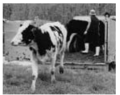
牧場内は「立入禁止」です

本人、配偶者、世帯主の前年所得が一定基準以下、または失業などにより、国民年金の保険料を納付することができない方は、申請することにより保険料の全額または一部納付が免除される「保険料免除制度」があります。免除の基準となる所得については次の表でご確認ください。