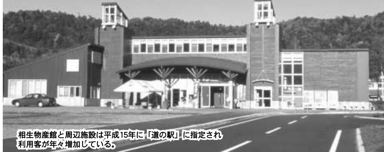
相生物産館と周辺施設は平成15年に「道の駅」に指定され、利用客が年々増加している。