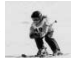
昨年実施されたスキー大会