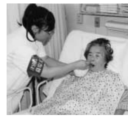
津別病院で食事介護を研修

消防署で実習を行った生徒は「現場の大変さを理解できました。実習中に数回出勤命令あり、隊員の顔つきが変わるところなど緊迫した仕事なんだと感じました」と感想を話してくれました。