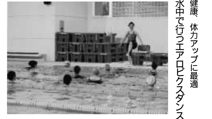
健康、体力アップに最適 水中で行うエアロビクスダンス

水中エアロビクス教室（主催・津別町教育委員会社会教育課）が津別町温水プール「すいむ」で、30名の参加があり、6月10日から毎週水曜日、7月8日まで5回開催されました。 水の抵抗を利用しながらバランスよく、シェイプアップすることが出来る水中エアロビクス。広い温水プールの中でたくさん参加者が、色々な音楽に合わせてダンスを踊っている様子は、とても綺麗でした。 参加している方から「自分のペースに合わせて、健康づくりが出来て、やってみる価値はありますよ」と話してくれました。