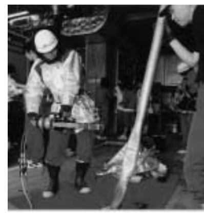
救助資器材の取り扱いを学びました

6月24日から6月26日までの3日間、津別高校の2年生52人が青葉幼稚園や保育所、消防署や津別病院など町内外の15事業所で職場実習を行いました。今年で13回目を迎えた実習は進路決定に役立つ目的で行われ、生徒たちは社会のルールやマナーの修得に励んでいました。