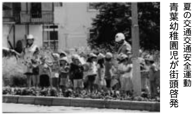
夏の交通安全運動 青葉幼稚園児が街頭啓発

7月9日、夏の交通安全運動（7月17日、26日）に併せて、国道240号沿いで青葉幼稚園児32人が通行するドライパーに、自分でつくった小旗を振りながら、交通安全を呼びかけました。 また、交通指導車のマイクを使って、自分の名前を言うてから、「お酒を飲んで運転しないで下さい」「運転しながら携帯使ったらダメですよ」「スピードの出しすぎ注意」と可愛い声で、ドライパーに安全運転をお願いしました。 ドライパーのみなさん、安全運転で子供たちを悲惨な交通事故から守りましょう！