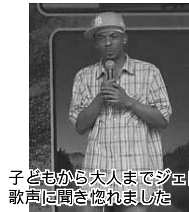
子どもから大人までジェロの歌声に聞き惚れました