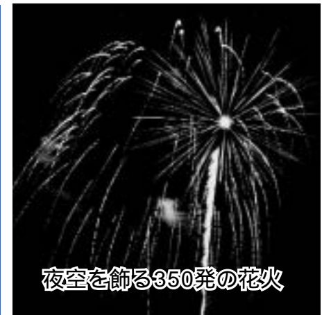
夜空を飾る350発の花火