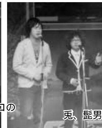
兎、髭男爵、笑い飯による爆笑ステージ!