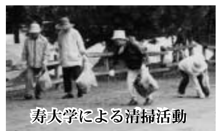
寿大学による清掃活動