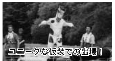
ユニークな衣装での出場!