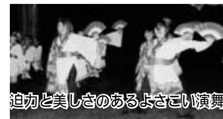
迫力と美しさのあるよさこい演舞