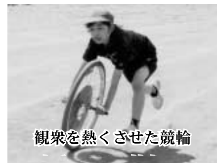
観衆を熱くさせた競輪