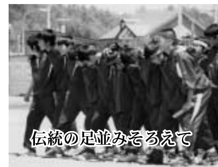
伝統の足並みそろえて