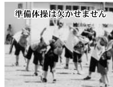
準備体操は欠かせません