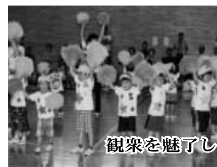
観衆を魅了した可愛らしい遊技