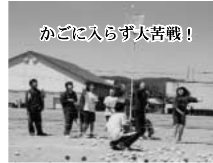
かごに入らず大苦戦!