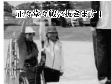
正々堂々戦い抜きます!