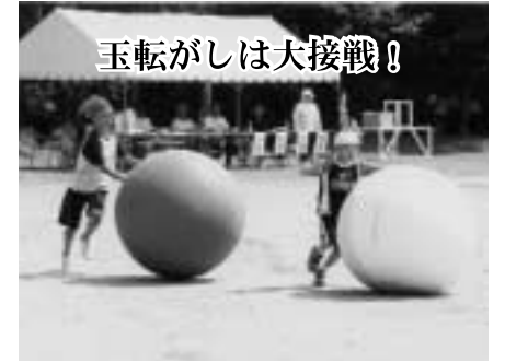
玉転がしは大接戦!