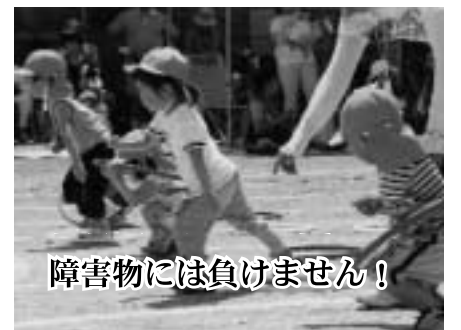
障害物には負けません!