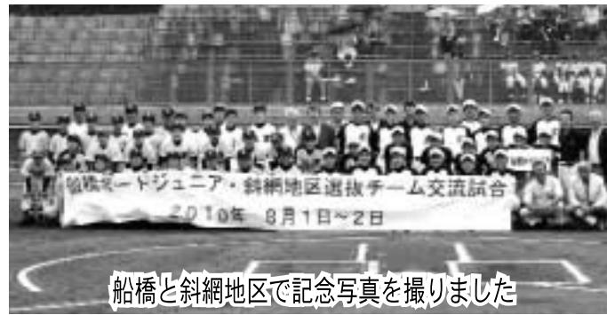
船橋と斜網地区で記念写真を撮りました