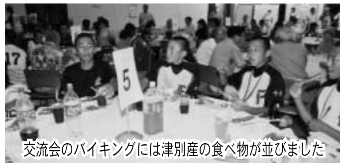
交流会のバイキングには津別産の食べ物がありました

8月1日、2日の両日、船橋ポートジュニアチーム（船橋市内の選抜チーム）と斜網地区選抜チームの軟式野球交流試合が、共和野球場で開催されました。