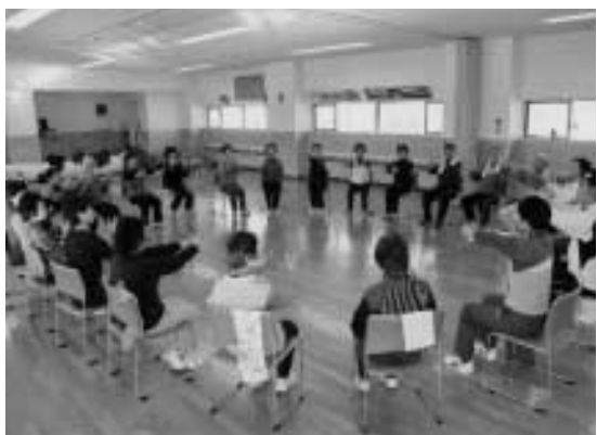
冬場の体力増進を目指す シルバースポーツ教室開催

1月11日から3月15日までの毎週火曜日、運動不足になりがちな冬場の健康を維持することを目的に、シルバースポーツ教室が中央公民館で開催されています。この教室では自宅でも簡単にできる筋力トレーニングやストレッチを行い、運動することの大切さを学びます。最初の教室では、体育指導委員と一緒にいすに座りながら指や手足の軽いストレッチを行いました。今後は、自分の健康状態に合わせてバランス運動やリズム体操を行い、日ごろの運動不足を解消します。