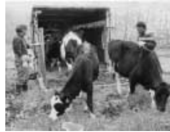
牧場内は「立入禁止」です

毎年、牧場内に山菜採りなどを目的として無許可で入る方が多く、故意による柵の破損が発生しています。牧場内には「関係者以外立入禁止」となっていますので、「ご理解願います。また、牧道に車などを止めることも牧場管理の支障となりますので、許可無く牧場内への出入りはしないようお願いいたします。」