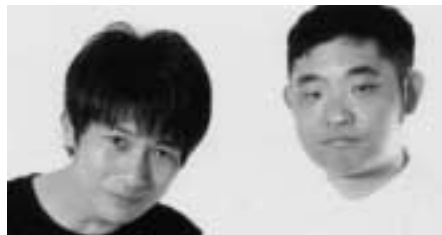
キングオブコメディ