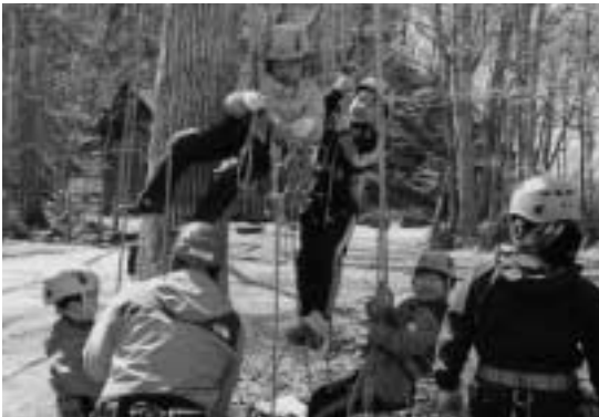
自然の楽しさを体で学ぶ ツリーイング体験会が開催

木登り体験は、午前と午後の2回に渡って行われ、21人の子も達が高さ20mほどの木に挑戦しました。苦戦する子どもやアツという間に頂上へたどり着く子どももいて、頂上からは小学校が見えます。怖かったけど楽しかったです」と木登りの楽しさを体感しました。