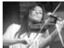
百香(ヴァイオリン)