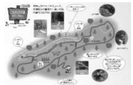
森林セラピー地図

以上のことから、森林セラピーロードを歩くことで、人の五感のうち、視覚・聴覚・触覚・嗅覚の4つの感覚を使ったことになり、自然と一体になることが交感神経を抑え、副交感神経を活性化させる重要な身体反応を提供してくれます。是非自分の体と心をリフレッシュしてください。 そして、ランプの宿森つべつ「上里温泉」(PH9.1)「お肌ツルツル、美肌の湯」でゆっくり温まってお帰りください。