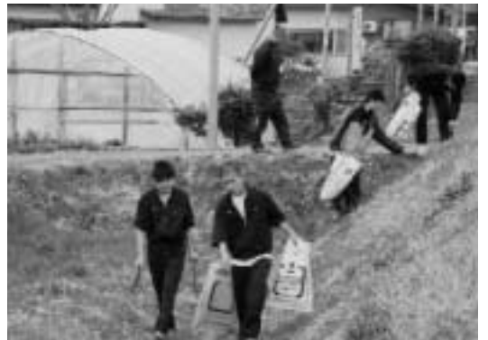
町内清掃ボランティア 津別高校生がゴミを回収

この活動は、昭和58年から続けられていて、今年で29回目になります。生徒数が減り、ゴミを拾う範囲が狭くなりましたが、ボランティア局長を始め、多くの生徒が真面目に拾っている姿が見られました。