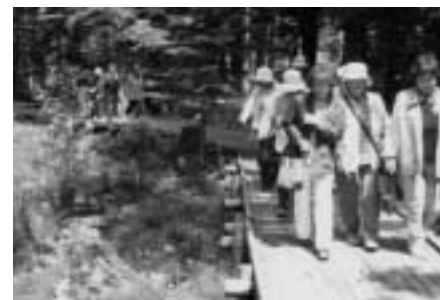
花の美しさ、川のせせらぎ、木の形、花や木の匂いを楽しみます。

木々の中に立っていると、何もしなくてもそれだけで心が癒されますが、さらに、効果的に森林パワーを感じるためのキーワードがあります。それは人間に備わっている5つの感覚「五感」です。人間の体には、視覚・聴覚・触覚・嗅覚・味覚と呼ばれる感覚があり、これらを意識して個人の価値観に応じた森林セラピーを楽しむことにより、森の力をより明確に実感できます。