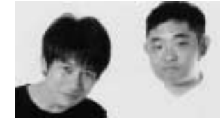
キングオブコメディ