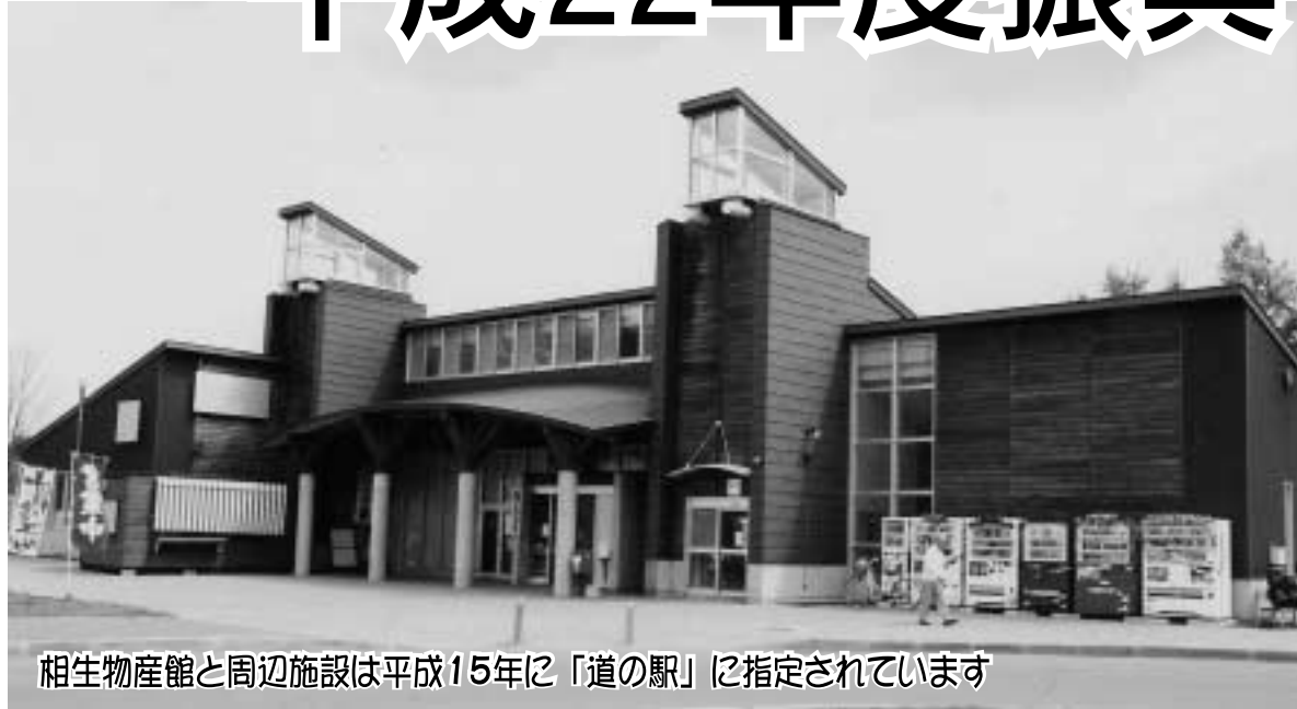
相生物産館と周辺施設は平成15年に「道の駅」に指定されています