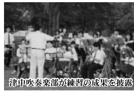
津中吹奏楽部が練習の成果を披露