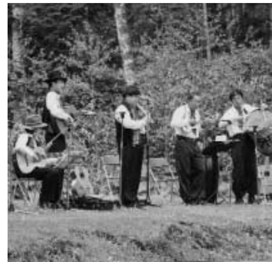
フォルクローレ「オコンコロ」による演奏

6月11日、12日は、くりん草フェスティバルの始まりを告げる「森林セラピーWeek」です。11日は、スイスヨーデルフェストにおいて、日本人で初めて最高クラスの評価を受けたスイスヨーデルアンサンブル「エンツィアン」のコンサートが行われ、「エーデルワイス」やお馴染み「アルプスの少女ハイジ」の歌声を披露しました。12日は、フォルクローレ「オコンコロ」によるコンサート。ケナチやサンポーニヤといった民族楽器を使用し、独特な曲調で「コンドルが飛んでいく」や「花祭り」などの演奏が行われました。