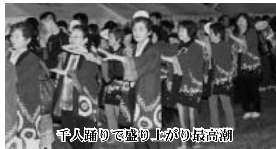
千人踊りで盛り上がり最高潮