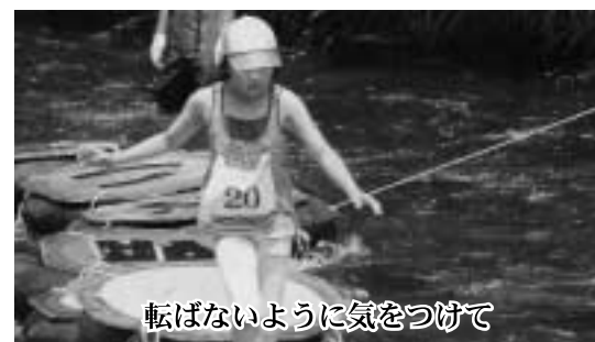
転ばないように気をつけて