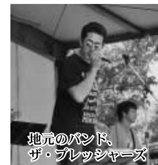
地元のバンド、 ザ・プレッシャーズ