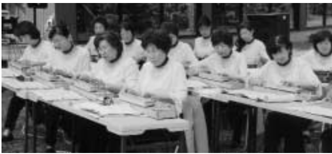
津別奈々サークルによる大正琴の演奏