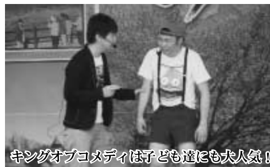
キングオブコメディは子ども達にも大人気!