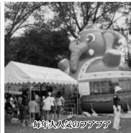
毎年大人気のフアフア