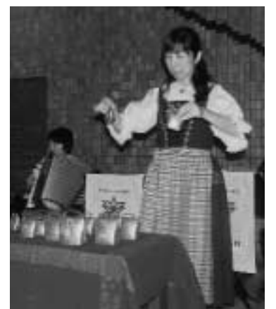
音階が違うカウベルを慣らす「ツィーゲングロックン」