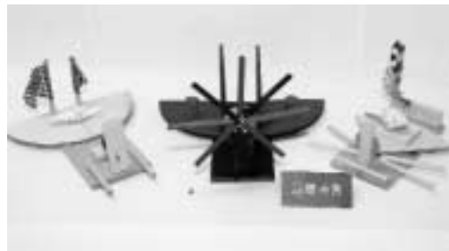
2010年子どもジュニアの部最優秀作品「船」

今年のテーマは「あったらいいなあ、こんなもの」 ～時計・カレンダー・タペストリー・イス・小物入れなど、普段生活で あればいいものを募集します～