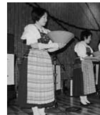
器に硬貨を入れて音を奏でる「ターラシュピンゲン」