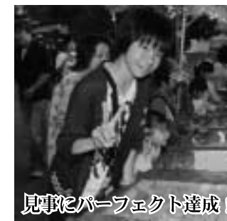
見事にパーフェクト達成!