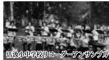
活波小中学校リコーダーアンサンブル