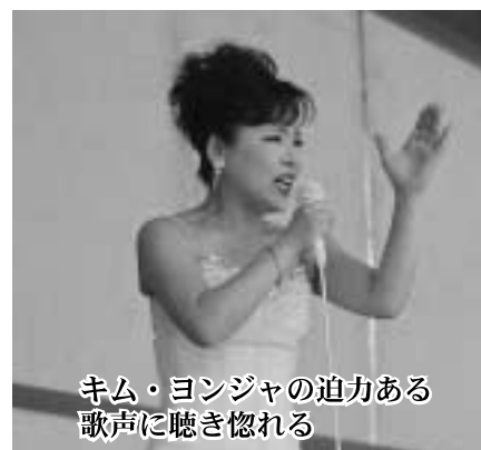
キム・ヨンジャの迫力ある 歌声に聴き惚れる