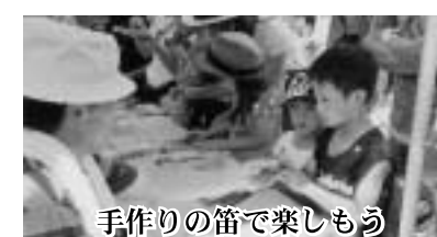
手作りの笛で楽しもう