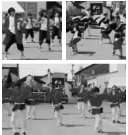
津高生によるよさこい演舞

7月9日・10日の2日間、54回目を迎える津別高校学校祭が行われました。 メインイベントのあんどんパレードでは1年生が「ドラゴンボール」、2年生は「みんなオハナ」、3年A組は「花鳥風月」、3年B組は「ねぶた」をモチーフにしたユニークな山車を連ねて町内を練り歩き、沿道の町民から喝采を浴びていました。 また、引き続き津別病院駐車場で行われた学年対抗のよさこい演舞では、息の合った踊りで観客を魅了した3年生のチーム「我愛羅」が見事優勝しました。