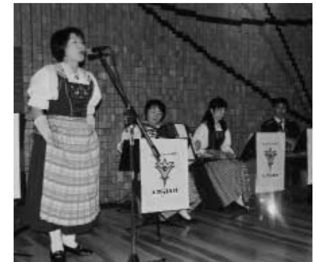
スイスヨーデルアンサンブル「エンツィアン」による演奏