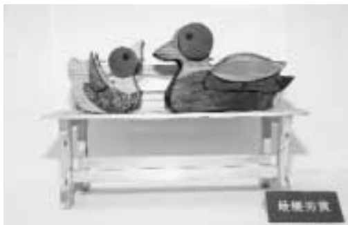
2010年子どもシニアの部最優秀作品 「ベンチでくつろぐあひるの親子」

2010年大人の部最優秀作品「森の器」 私たちは森の恵みや大切さを理解していても、生活の中ではつい忘れがちです。日常の暮らしの中で、使いながら木や森の良さを身近に感じられるようなものがあれば、もっと自然と仲良くなれるように思っています。生活の中にある用品が「使って楽しい、飾って楽しい」をキーワードにした木工クラフトとして生まれてくるよう、クラフト展を実施します。みなさんからの応募をお待ちしています。