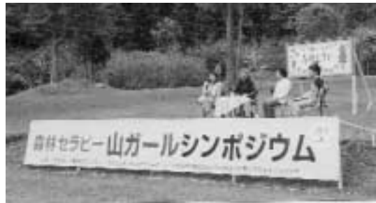
2人の講師と町長によるパネルディスカッション

このシンポジウムは全国モーターポート競走施行者協議会からの拠出金を受けて実施されたものです。