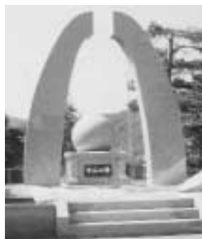
平成14年に建立された「平和の碑」

津別町は、平成10年9月に左記の「非核・平和の町宣言」を行い、核兵器の廃絶を訴えています。また、平成14年には幸町の忠魂碑跡地に「平和の碑」を建立し、恒久平和の実現を願っています。さらに、平成21年に、連帯して世界恒久平和の実現を願う「平和市長会議」に加盟しました。