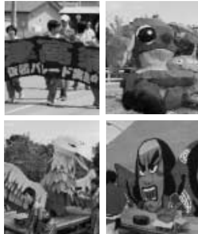
あんどんパレードは力作揃い