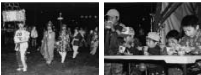
楽しい仮装に会場内は笑いでいっぱい 好評のかき氷早食い大会

毎年好評のアメリカン盆ダンス 目指せ!優勝賞金 子ども・大人仮装盆踊り 津別の特産品が当たるお楽しみ抽選会 会場 津別神社境内 仮装申し込み 当日会場で行います 問い合わせ先 津別観光協会事務局(役場内) ☎76-2161(内線315)