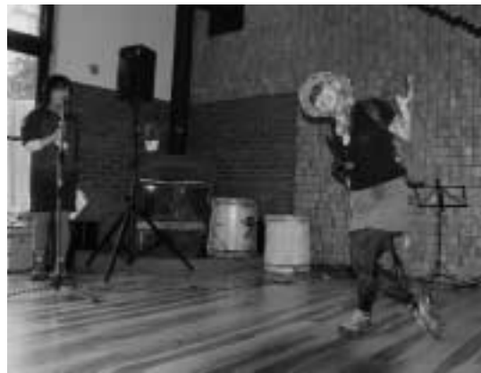
ファッションショーでは個性豊かな衣装を披露

今年からロングラン開催となった「第6回クリンソウまつり」が、6月18日から26日の土・日曜日に行われました。18日は、森林ウオーク・ファッションショーが行われ、男性5人、女性5人がそれぞれ山をイメージした個性豊かな衣装でポーズを決め、観衆からは声援が絶えませんでした。19日には、森林セラピー山ガールシンポジウムが行われ、女性世界初アルプス三大北壁完登者の今井通子さん、エベレスト登頂者の田部井淳子さんが講師として招かれ、「森林浴の効果」や「山の楽しい歩き方」などの講演とパネルディスカッションがあり、430名が参加しました。