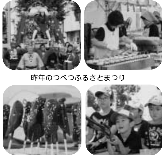
昨年のつべつふるさとまつり