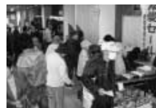
例年賑わう友愛セール

ふれあいステージ 出演団体交渉中 体験コーナー 高齢者疑似・車イス体験 各種販売 更生保護女性会による友愛セ-ル・介護用品・焼き鳥などの販売