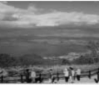
問い合わせ先 網走建設管理部 事業課 ☎ 0152-41-0742

次の道道は、来年春まで冬期間全面通行止めです。 訓子府津別線 ① 訓子府町界から最上(道道二又北見線交点)(11月30日～平成24年5月10日) ② 最上道有林153林班から沼沢241番地(11月30日～平成24年5月10日) 屈斜路津別線 ① 弟子屈町ウランコシゲートから上里642番地1(11月4日～平成24年5月30日) ② 二又北見線 ① 二又(町道368号線交点)から最上(道道訓子府津別線交点)(11月30日～平成24年5月10日) ② 最上(道道北見津別線交点)から北見市若松(道道北見美幌線交点)(11月30日～平成24年5月10日)