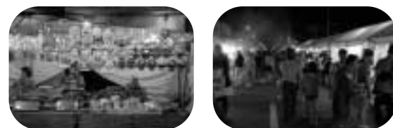
昨年のつべつふるさとまつり

ふるさとまつりのため9月9日午前9時から11日の正午まで、左記の区間が交通規制されます。一般車両はこの期間中通行できませんので、ご協力をよろしくお願いいたします。 また、町営バス開成線は、林石ガソリンスタンド跡前交差点から五差路までの町道102号線の間は、う回することになります。このため、西町停留所が使用できなくなります。ご迷惑をお掛けしますが、ご理解とご協力をお願いします。