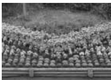
努力賞 豊永第三自治会