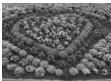
優良賞 柏町自治会