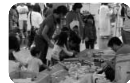
子どもたちに人気の射的・スマートボール・とんちん館