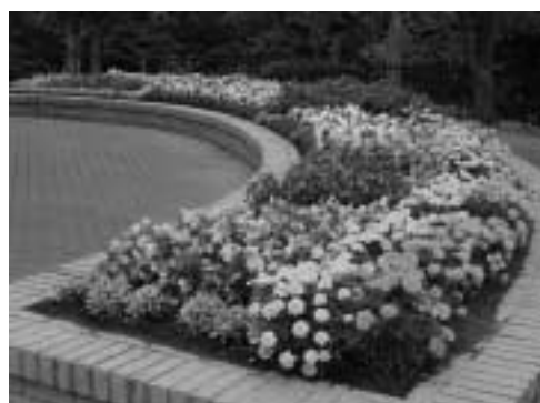
優秀賞 活汲中央自治会