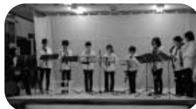
活汲小中学校リコーダーアンサンブルと津別中学校吹奏楽部