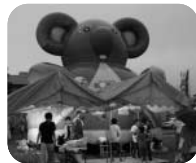
フアフアは子どもに大人気