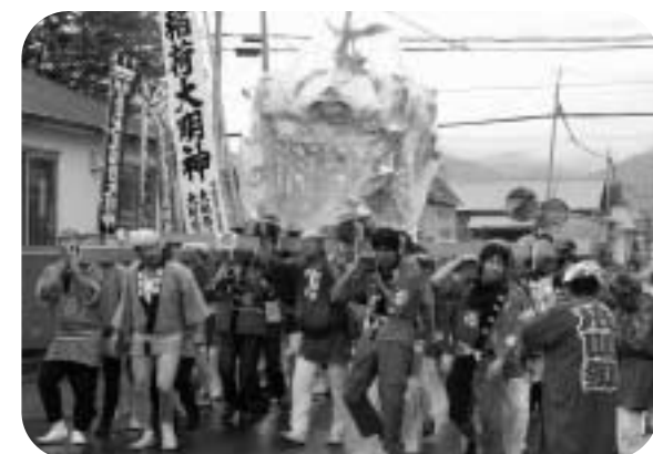
町内を練り歩く御輿渡御