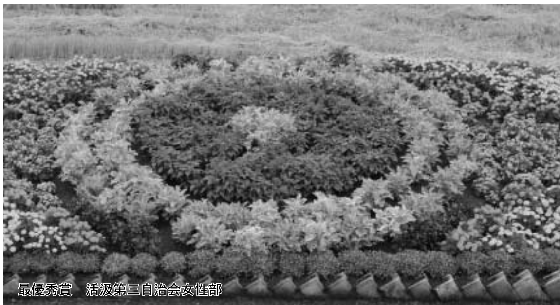
最優秀賞 活汲第三自治会女性部