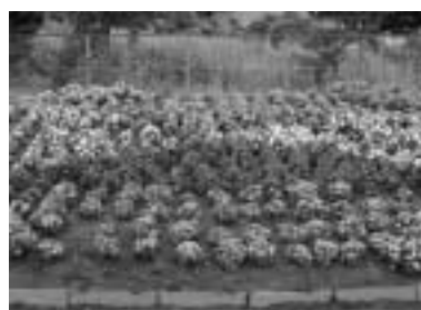
優良賞 本町自治会