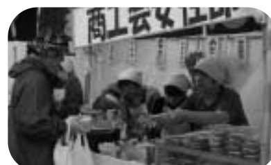
手作りの露店がたくさん！！