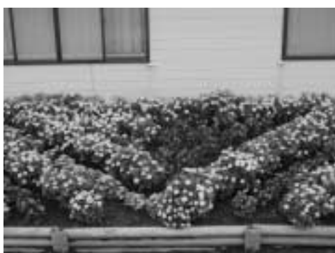
優秀賞 東達美自治会女性部