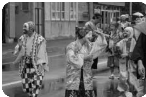
千葉県船橋市の郷土芸能「ばか面おどり 笑運連」の皆さん

今年の夏も、花いっぱい運動が展開され、各地域の人たちが丹精込めて育てた花々が、町内に咲き誇りました。 このほど、町内の花壇を対象にした「第34回花壇コンクール」が、花のまち推進協議会の主催により開催され、16団体が参加しました。 8月10日に行われた審査会では、活汲第三自治会女性部が最優秀賞に選ばれたほか、合わせて10団体が入賞しました。表彰式は同月20日、林業研修会館で行われ、入賞者に表彰状が手渡されました。