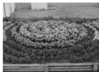
努力賞 共和第二自治会

今年の夏も、花いっぱい運動が展開され、各地域の人たちが丹精込めて育てた花々が、町内に咲き誇りました。 このほど、町内の花壇を対象にした「第34回花壇コンクール」が、花のまち推進協議会の主催により開催され、16団体が参加しました。 8月10日に行われた審査会では、活汲第三自治会女性部が最優秀賞に選ばれたほか、合わせて10団体が入賞しました。表彰式は同月20日、林業研修会館で行われ、入賞者に表彰状が手渡されました。