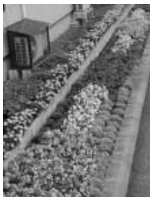
優良賞 津別町商工会女性部