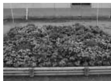
優良賞 布川自治会