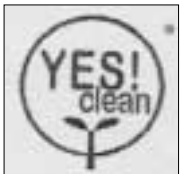
<イエス!クリーンマーク>

北のクリーン農産物表示制度に登録されるためには、通常の農薬使用回数の5割以下が基準とされており、生産集団の構成員による「栽培基準」「栽培協定」を作成し北海道協議会へ申請し認証を受けます。認証されると愛称の『YES! clean』のロゴマークとともに栽培内容などがセットで表示されることとなります。北のクリーン農産物表示制度は、地域ぐるみの取り組みを目指すもので、「個人ではなく、個々の生産者のままとりであり、地域的に取り組む」といのが特徴です。