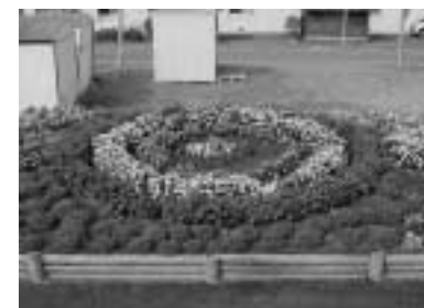
優良賞 共和第2自治会