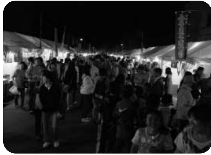
町民手づくりの出店が並ぶ会場は大にぎわい

第22回つべつふるさとまつりが、9月9日と10日の二日間、五差路から津別神社前の町道で開催されました。 好天に恵まれる中、町内外から訪れたたくさんのお客様が、職場や団体ごとの手作り露店が軒を連ねる会場で、秋祭りの風情を満喫しました。 津別神社例大祭では、境内で活汲小中学校リコーダーアンサンブルや津別中学校吹奏楽部などが演奏を披露。本祭が行われた10日には、みこしや伝統の駒踊りが町内を練り歩き、祭りの雰囲気盛り上げました。