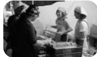
おいしそうな出店がたくさん！！