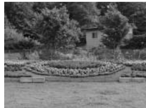
優秀賞 本町自治会