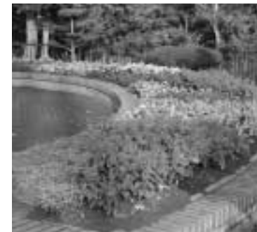
努力賞 活汲中央自治会

今夏も「津別町花いっぱい運動」が展開され、皆さんが心を込めて育てた美しい花々が、通りや花壇を彩りました。 8月には、町内17団体が参加して、「第35回花壇コンクール」(主催 津別町花のまち推進協議会)を開催。 8月26日に行われた審査会で、幸町自治会が最優秀賞に選ばれたほか、合わせて10団体が入賞しました。 表彰式は9月19日に林業研修会館で行われ、入賞した団体のみなさんに表彰状が贈られました。