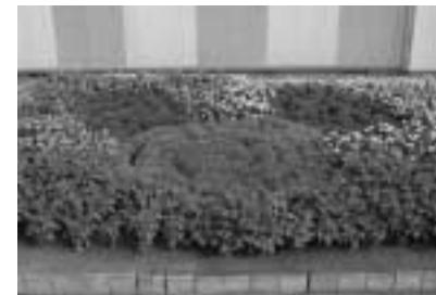
努力賞 本岐保育園父母の会