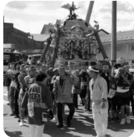
町内を練り歩く御輿渡御