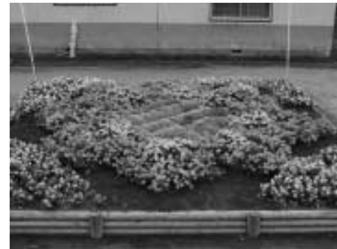
優秀賞 布川自治会