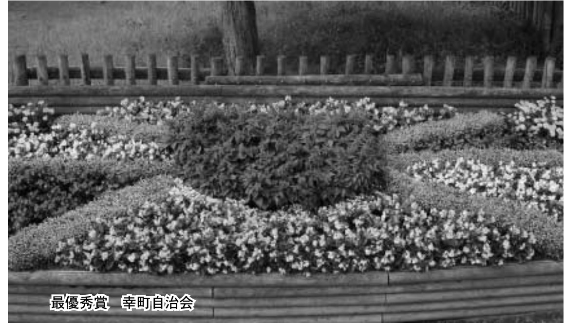
最優秀賞 幸町自治会