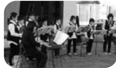
活汲小中学校リコーダーアンサンブルと津別中学校吹奏楽部の演奏

第22回つべつふるさとまつりが、9月9日と10日の二日間、五差路から津別神社前の町道で開催されました。 好天に恵まれる中、町内外から訪れたたくさんのお客様が、職場や団体ごとの手作り露店が軒を連ねる会場で、秋祭りの風情を満喫しました。 津別神社例大祭では、境内で活汲小中学校リコーダーアンサンブルや津別中学校吹奏楽部などが演奏を披露。本祭が行われた10日には、みこしや伝統の駒踊りが町内を練り歩き、祭りの雰囲気盛り上げました。