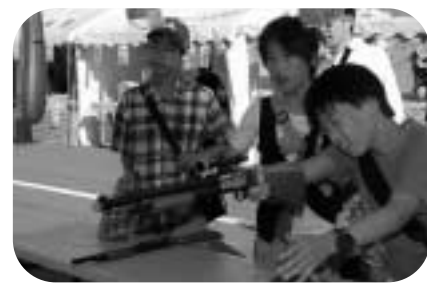
まつりの定番スマートボール、金魚すくい、射的