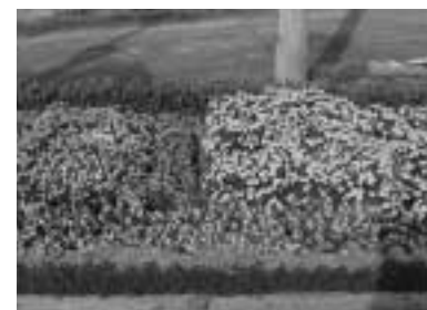
優良賞 柏町自治会