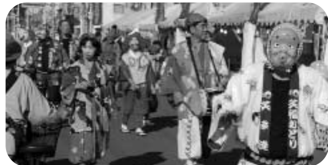
船橋市の郷土芸能ばか面おどり、帯広市の笑楽会の皆さん