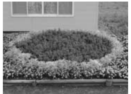
優秀賞 豊永第一農事組合育苗団体