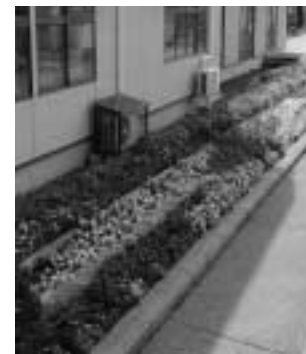
優良賞 津別町商工会女性部