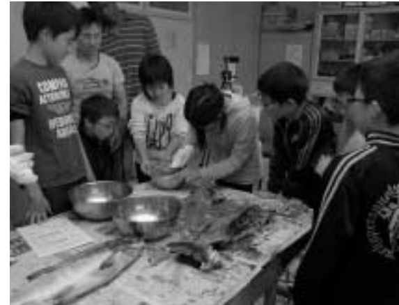
津別小学校の食育への取組