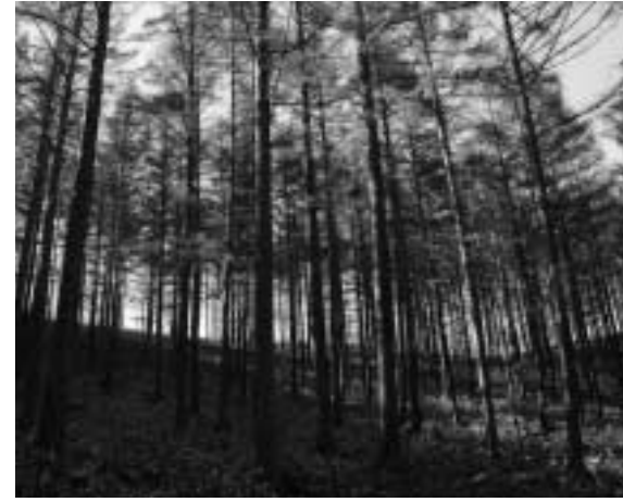
C O2削減へむけた取組