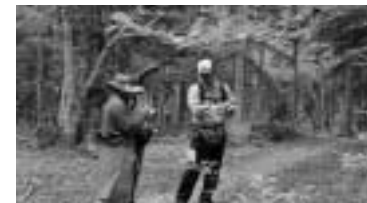
森林セラピーの様子

津別町のHPに、環境基本計画全文が掲載されております。また、庁舎1階④窓口住民企画グループでも閲覧可能ですので、ご覧ください。 問い合わせ先 住民企画課住民企画グループ ☎76-2151(内線215)