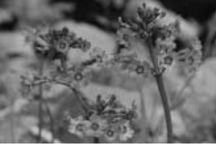
可れんに咲くクリンソウ