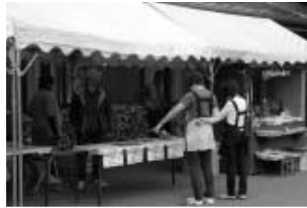
木の実などを使ったクラフト体験