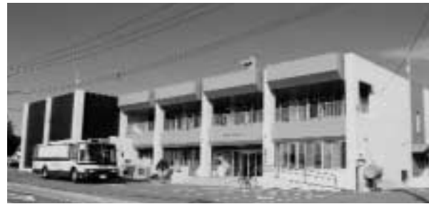
津別町 振興公社 損益計算書 (平成25年4月1日から平成26年3月31日まで) 単位:千円

公共施設の清掃・管理業務について は、日常清掃業務8施設、特別清掃業務14施設、施設管理業務11施設、公園管理業務5施設、公衆浴場管理業務1施設、道立施設管理業務1施設は、ほぼ当初の計画どおり事業を行いました。グレステンスキー事業については、昨年度に引き続き5月から10月までの