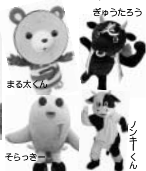
タケカワユキヒデ