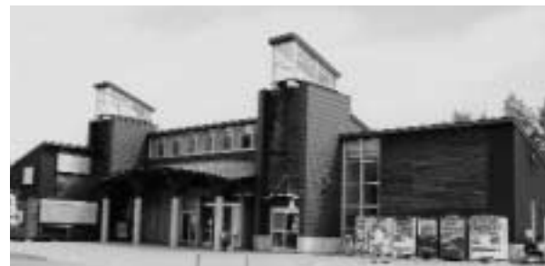
相生 振興公社 損益計算書 (平成25年4月1日から平成26年3月31日まで) 単位:千円