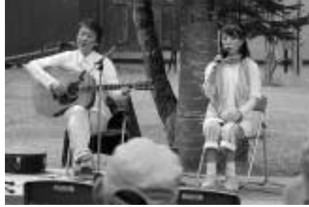
夫婦デュオ「二人静」の演奏

「2014 くりん草フェスティバル」が、6月14日から29日までの土・日曜日、ノノの森（上里町民の森自然公園の愛称）とランブの宿・森つべつで開催されました。 クリンソウが群生する散策路周辺では、家族連れなどが見事に咲きそろった花を眺めながらゆったりとした時間を過ごしていました。また、期間中は森林セラピー体験や森林ヨガ体験、ソリーイングなども行われ、参加者は森の持つ癒しの力を体感しました。 ゲストミュージシャンや、津別の音楽愛好サークルなどが日替わりで演奏する「森の音楽会」も連日行われ、会場は町内外から訪れた多くの人で賑わいました。