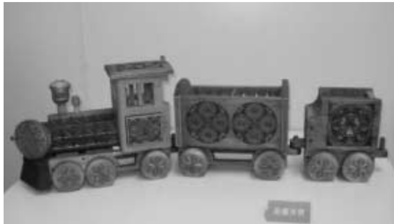
2013年大人の部最優秀作品「夢ポツポ」

私たちは森の恵みや大切さを理解していても、生活の中ではつい忘れがちです。日常の暮らしの中で、使いながら木や森の良さを身近に感じられるようなものがあれば、もっと自然と仲良くなれるように思います。生活の中にある用品が『使って楽しい、飾って楽しい』をキーワードにした木工クラフトとして生まれてくるよう、クラフト展を実施します。みなさんからの応募をお待ちしています。