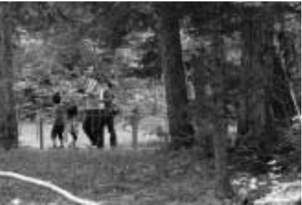
緑豊かな森の散策路