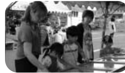
昨年のふるさとまつりの様子