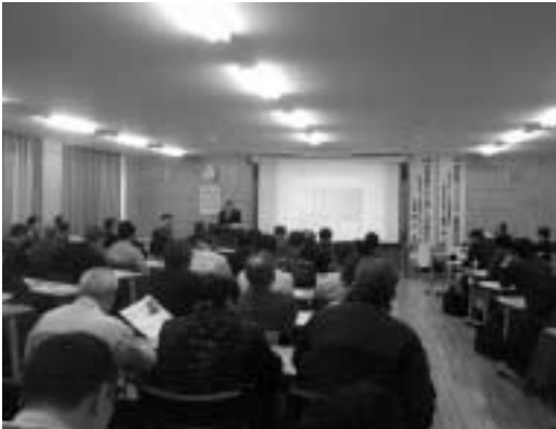
講演を熱心に聴く参加者

ない。津別町型をどう作っていくかが大事な課題である。少しずつ時間をかけて一歩ずつ展開していければ、おもしろい展開が見えてくるのではないかと。津別町は、有機酪農が日本初の先進的な取り組みであり、是非、森林バイオマスと有機酪農のセットで取り組んでもらいたい。