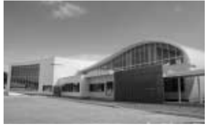
4月開園の認定こども園