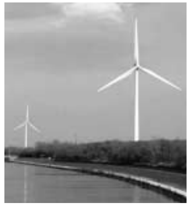
いしかり市民風力発電所

9つのローカルベンチャーを村の外から来た若者(よそ者)が行っている。町が元気になるための2つの要素「よそ者」「ばか者」を取り組みの観点として考えてはどうか。