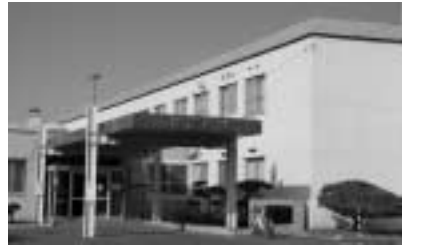
地域医療の拠点・津別病院