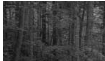
愛林のまちなか木材資源