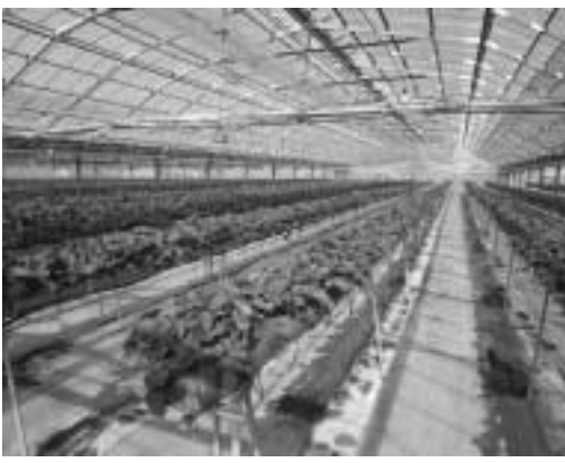
農業用ハウスによる施設園芸(イメージ)

津別町民の消費電力量は、ざっくり試算して1043万5500kWhを消費している計算になる。同じ電気の量を木質バイオマス発電でつくるとしたら約1490kwの設備が必要となる。津別町には豊かな地域資源があるの