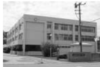
津別高校振興対策を継続