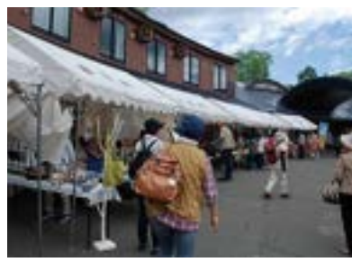
▲賑わうショッピングモール