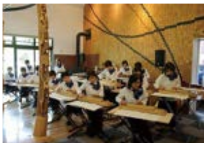
▲森の音楽会 瑠璃の会の大正琴演奏