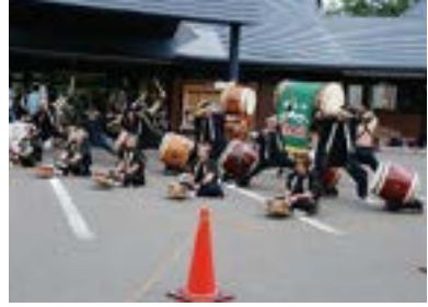
▲森の音楽会 山鳴太鼓保存会の演奏