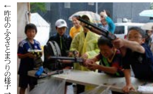
← 昨年のふるさとまつりの様子 →

※ふるさとまつりのため9月9日午前9時から11日の正午まで、左記の区間が交通規制されます。一般車両はこの期間中通行できませんので、ご協力をよろしくお願いいたします。