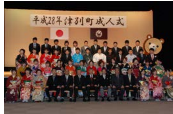
▲式の最後に全員で記念撮影

問い合わせ先 住民企画課 税務収納グループ ☎ 76 - 2151（内線 220、221）