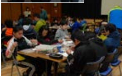
▲モデルロケット作りに取り組む子どもたち