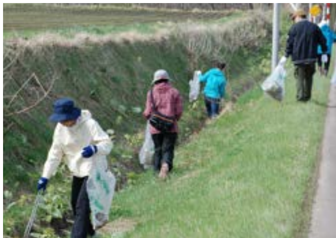
町道沿いのごみを拾う道路クリーン作戦参加者の皆さん

ポイ捨てされた空き缶やペットボトルなどが多く見られ、多くの町民のご協力により回収されたゴミの量は370kgにも及びました。今後もごみゼロを目指し、皆さんのご協力をお願いします。