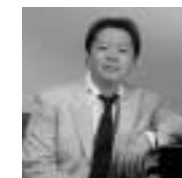
タケカワユキヒデ