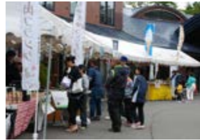
▲出店が並ぶ森のマーケット