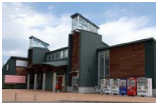
相生振興公社損益計算書 単位：千円 (平成27年4月1日から平成28年3月31日まで)

厳しい状況は続いています。決算は、税引き前当期利益271万8千円、法人税充当額69万9千円を差し引き、当期利益201万9千円という結果となりました。職員配置については、正規職員1名、役員派遣臨時職員1名、パート職員数名に加え、地域おこし協力隊員の協力を得ながら業務を行いました。