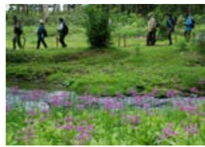
▲クリンソウが咲く散策路

6月18日から26日までの土・日曜日、上里町民の森自然公園（愛称・ノノの森）及びランプの宿・森つべつを会場に『第11回クリンソウまつり』が開催されました。 まつり期間中は、ゲストミュージシャンや町内の音楽愛好サークルなどが日替わりで演奏する森の音楽会、森林セラピー体験、森林ヨガ体験、ツリーイングなど様々な催しが行われました。 可憐なピンクのクリンソウが新緑に映える散策路では、家族連れや観光客が森の癒しを体感。手作り雑貨や食べ物の屋台が並ぶ森のマーケットも開かれ、会場は町内外から訪れた多くの人で賑わいました。