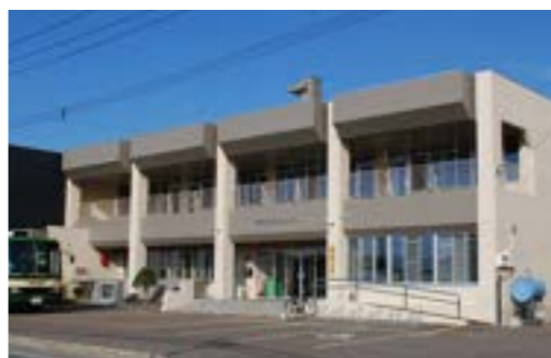
津別町振興公社損益計算書 単位：千円 (平成27年4月1日から平成28年3月31日まで)