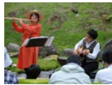
▲森の音楽会「ホラネ口」の演奏