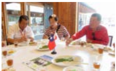
▲さんさん館で昼食 手づくりで温かいおもてなし