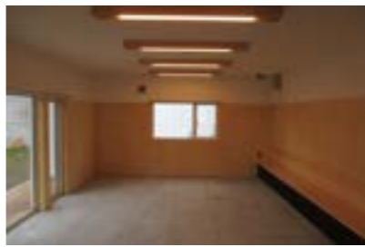
▶多目的ルーム内部