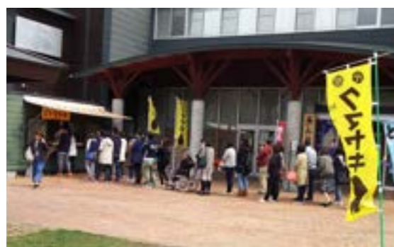
▲クマヤキ売り場には行列もできました

今年5月でもストーリーが必要日が多いなど、なかなか体調管理の難しい月でした。幸いゴールデンウィーク中は、天候に恵まれ、直前にクマヤキが道新などのメディアに取り上げて頂いたおかげもあり、あいおい道の駅には多くのお客様にご来館いただきました。大変ありがたいことだと思います。 ◆ 私は津別町地域おこし協力隊員として丸2年が経ち、任期も残り1年となりました。知り合いとなった方も増え、さらに親交を深めた方もできました。