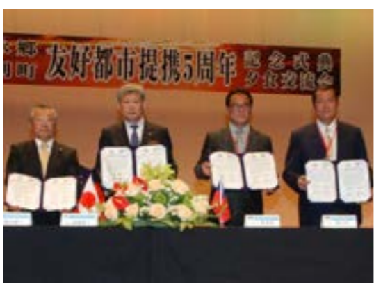
▲左から鹿中議長、佐藤町長、鄭郷長、頼主席