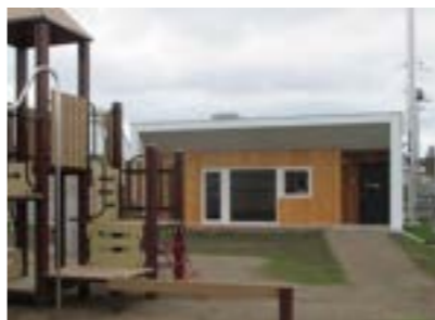
▶多目的ルーム外観