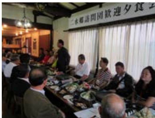
▲夕食会で交流を深める参加者