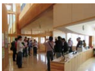
▲木の香りが漂う認定こども園見学