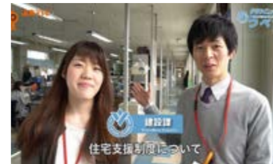
▲職員がキャスターに挑戦

前回放送では町長が登場したタウンニュースつべつ。今回は、広報5月号と一緒に配布した「平成29年度 暮らしのガイド」をわかりやすく説明。町では年間4億5千万円を各種支援制度に充てています。そんな町の助成制度を利用するためにどこのカウンターに行けばいいのか？職員本人が出演しご説明しています。どうぞご覧ください。