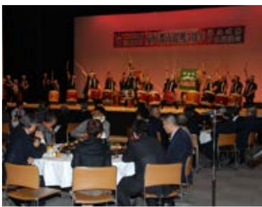
▲山鳴太鼓の演奏を楽しみながら夕食交流