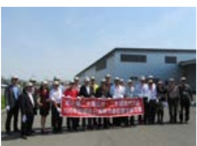
▲丸玉産業株式会社工場見学