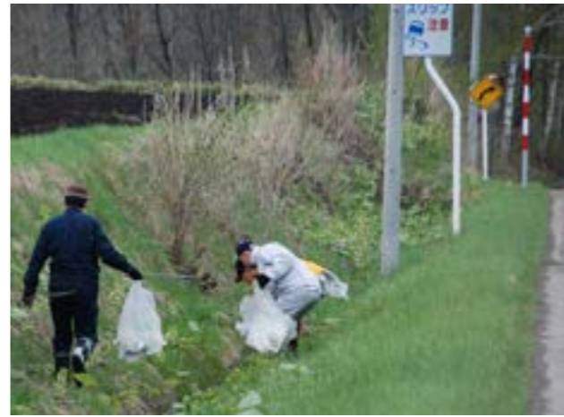
町道沿いのごみを拾う道路クリーン作戦参加者の皆さん

ごみゼロ運動の日（5月30日）を前に、5月13日、「道路クリーン作戦」（主催 津別町、津別町環境衛生推進協議会）が実施されました。 朝7時30分、農業者トレーニングセンター前に90人あまりの参加者が集合。数人ずつのグループに分かれて、ふれあい公園パークゴルフ場から美幌町との境界までの町道3号線沿いに、道路わきのごみやポイ捨てされた空き缶、ペットボトルなどを拾い集めました。 今回、多くの町民の方のご協力により回収されたゴミの量は、330kgにも及びました。今後もごみゼロを目指し、ご協力をお願いします。