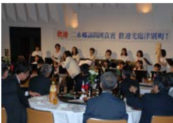
▲RECつべつの演奏に聴き入る