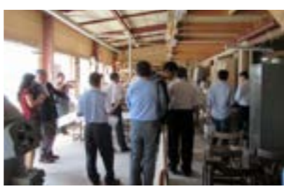
▲株式会社山上木工を見学。その後サンマルコ食品株式会社津別工場を見学