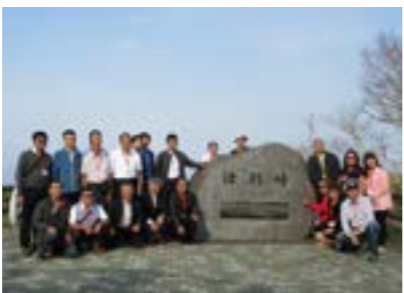
▲津別峠展望施設で記念撮影