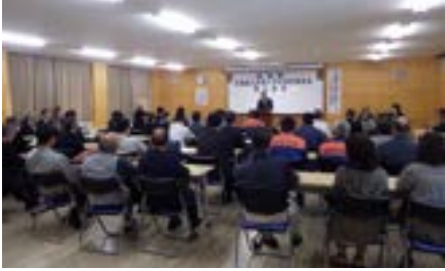
▲林業大学校誘致期成会設立総会の様子

学校誘致に向けた陳情・要請活動、林業関係機関や行政機関との連携、講演会や資料の配布による啓発・賛同者拡大などの取り組みを行う予定です。