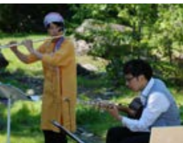
▲森の音楽会「ホラネ口」の演奏

12回目を迎える初夏の恒例イベント『クリ ンソウまつり』が、6月17日・18日、上里町 民の森自然公園（愛称・ノンノの森）及びラ ンプの宿・森つべつを会場に開催されました。 好天の下、ゲストミュージシャンや町内の 芸能・音楽愛好団体などが日替わりで演奏す る森の音楽会、森林セラピー、各種体験、ツ リーイングなど様々な催しが二日間にわたっ て行われ、町内外から訪れた多くの人で賑わ いました。 クリンソウの可憐な花が見ごろを迎えた散 策路では、家族連れや観光客が思い思いに森 林浴を楽しんでいました。