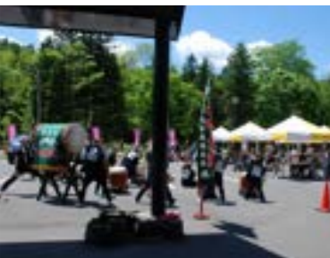
▲郷土芸能・山鳴太鼓保存会の演奏