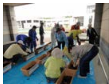
6月9日、津別中学校で行われた花植え