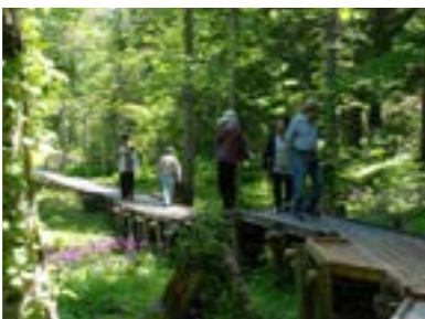
▲クリンソウが咲く散策路