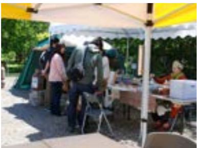
▲ノンノの森DE遊ぼう～各種体験