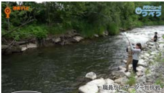
職員がレポーターに挑戦

みなさんアウトドア楽しんでますか？市街地から車で5分の巨大アウトドア施設「21世紀の森（総面積23ヘクタール）」。キャンプにアスレチック、釣りにBBQに森林学習館まで！家族みんなで一日中楽しめる森をご紹介します。津別の夏を満喫しましょう！！