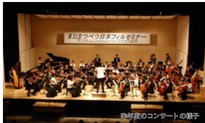
昨年度のコンサートの様子