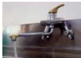
老朽化が進んでいます。

補助事業等により老朽施設 を計画的に更新し、今後も安 心安全な水道水を持続的に供 給していきけるよう努めてまい ります。