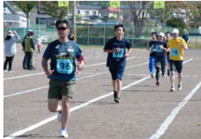
▲ゴール前で力走するランナー

秋の恒例スポーツイベント「第16回つべつ紅葉マラソン大会」が、10月1日、快晴の空の下で開催されました。 小学生から年配の方まで、400人を超えるランナーが、体力、経験に応じてハーフコース、10kmコース、5kmコース、3kmコースに参加。午前10時、各出発地点から津別小学校グラウンドのゴールを目指し同時にスタートしました。 同大会には、津別高校強歩大会の参加者もエントリーしており、部活や体育授業で鍛えた走力を発揮しハーフコース、10km