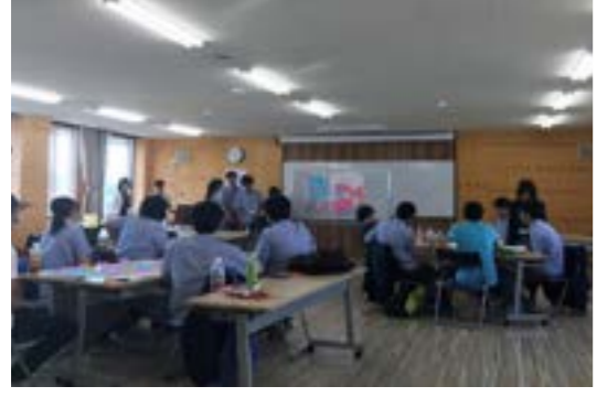
▶ 高大連携ワークショップの様子

今年度も、まちの再生・活性化について、大学生の力を借りながら、高校生が、若者視点のアイデアをまとめ、一般公開で発表しました。その後、最優秀賞に選ばれたグループは、昨年11月に筑波大学で開催された高大連携シンポジウムにおいて、多くの参加者の前で発表を行いました。