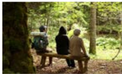
◀森林セラピー体験の様子 ▼ノンノの森・散策コース

開館期間 10月31日まで 開館時間 午前9時～午後7時 ※トイレは24時間利用できます。