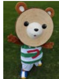
まる太くんと写真を撮ろう!

6月16日(土)・17日(日) 会場 上里町民の森自然公園(ノンノの森) ランプの宿 森つべつ