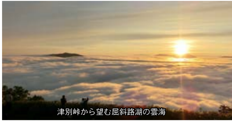
津別峠から望む屈斜路湖の雲海

津別峠から望む屈斜路湖のライブ映像が津別町ホームページからご覧になれます(1分ごとに更新)。