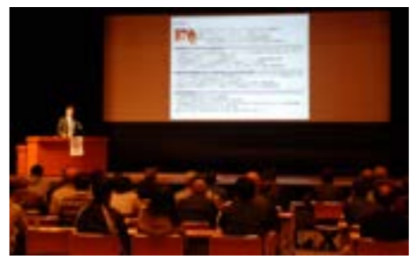
▲第三次選考の公開審査会の様子