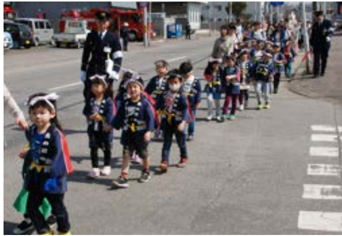
▲火災予防を呼びかける認定こども園の園児たち

津別消防署及び津別消防団による防火パレードが、春の火災予防運動期間中の4月21日に行われました。 津別消防署前での開会式に続いて、女性消防団員が掲げるプラカードを先頭に、自治会連合会や津別消防後援会、津別町防火管理者連絡協議会、老人クラブ、ハッピー姿の認定こども園の園児と保護者などが出発。消防署員、消防団員並びに車両隊と共に市街地を行進しながら、町民に火災予防を呼びかけました。 まだ空気が乾燥する時期ですので、これからも火の取り扱いには十分注意をしてください。