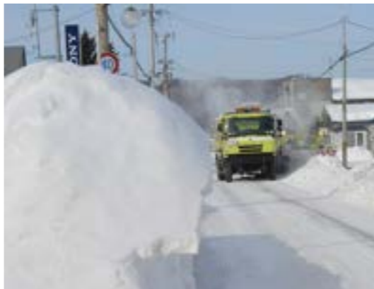
▲平成 22 年 1 月の大雪の様子