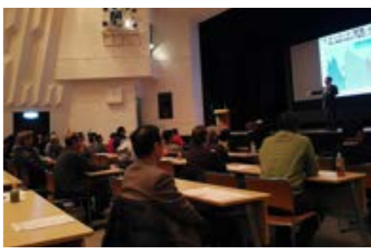
▶中央公民館での講演の様子

また、正確な額は把握できないが、外国人向け観光業も宿泊数を比較すると233%増と著しい成長が見られた。今、示したものはすべて津別町にあるもので、この地域が成長するための基礎は出ている。